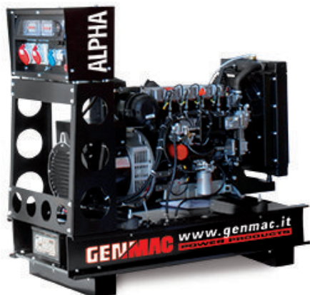
Изображение только для иллюстрации